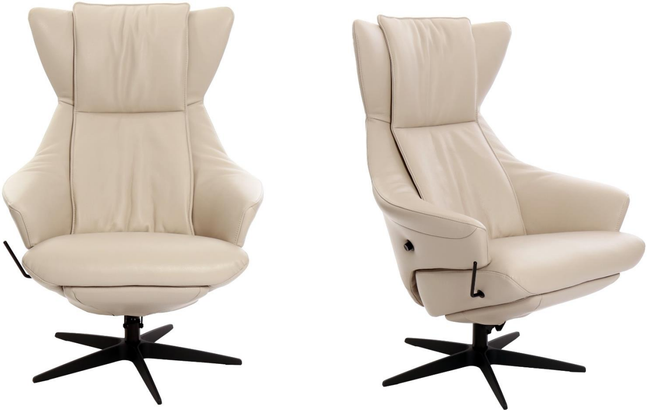
Afgebeeld Model TR