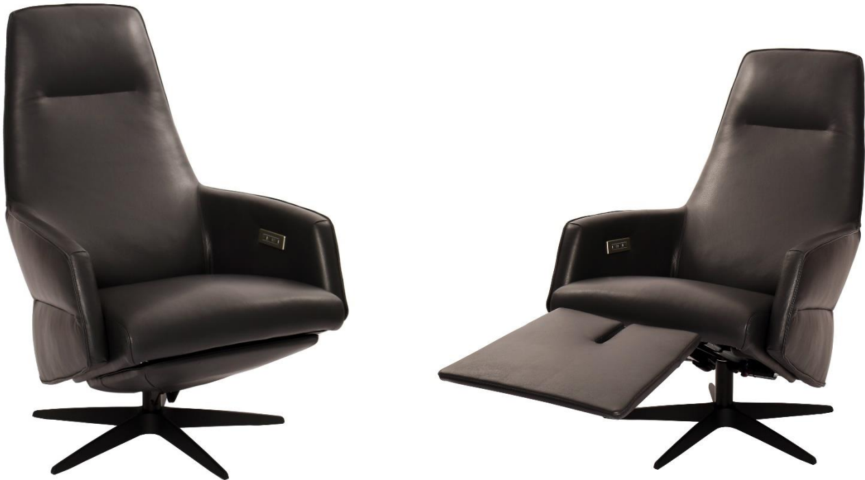
Afgebeeld Model ARC