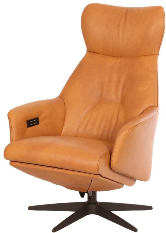
Afgebeeld Model ARC