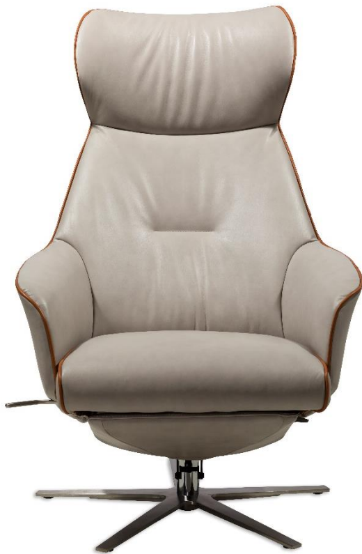
Afgebeeld Model TR