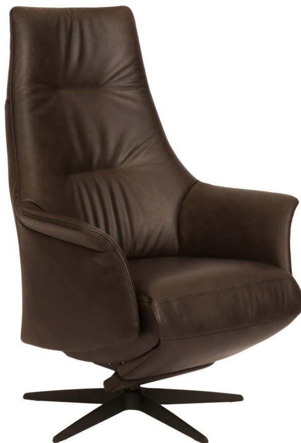
Afgebeeld Model Twinz