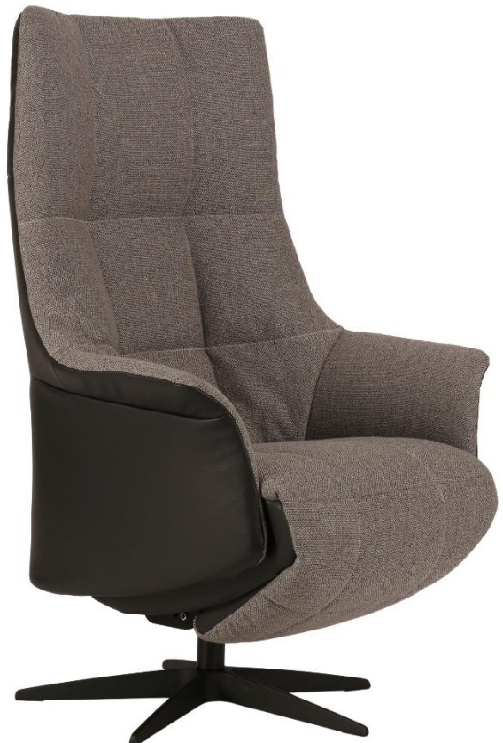
Afgebeeld Model Twinz