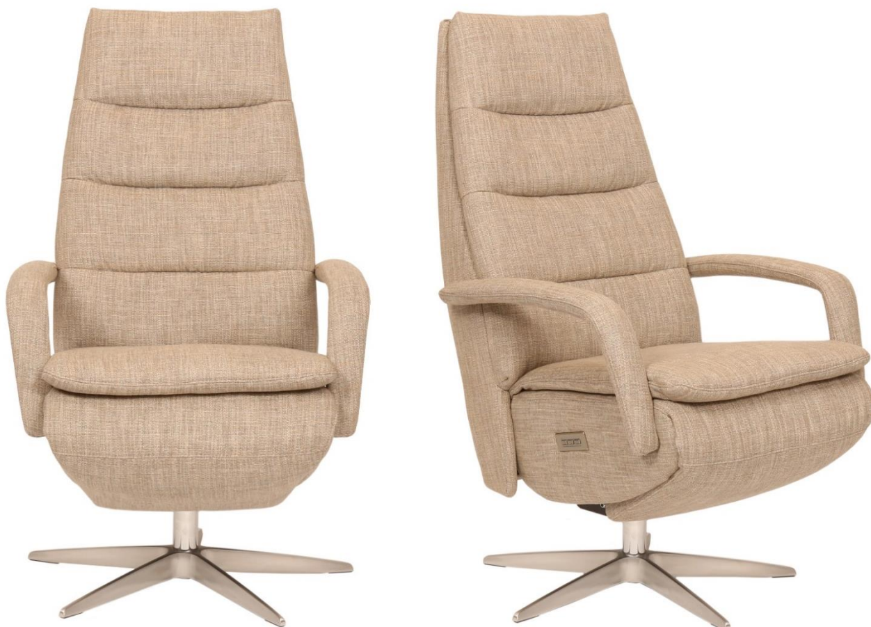
Afgebeeld Model Twinz

Afmetingen (cm): standaard is Medium (M)