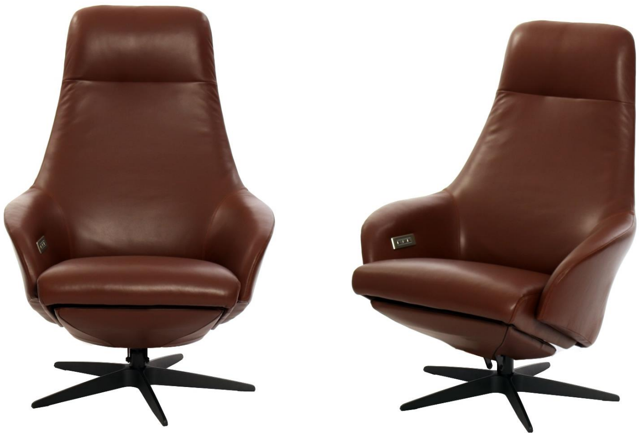
Afgebeeld Model ARC