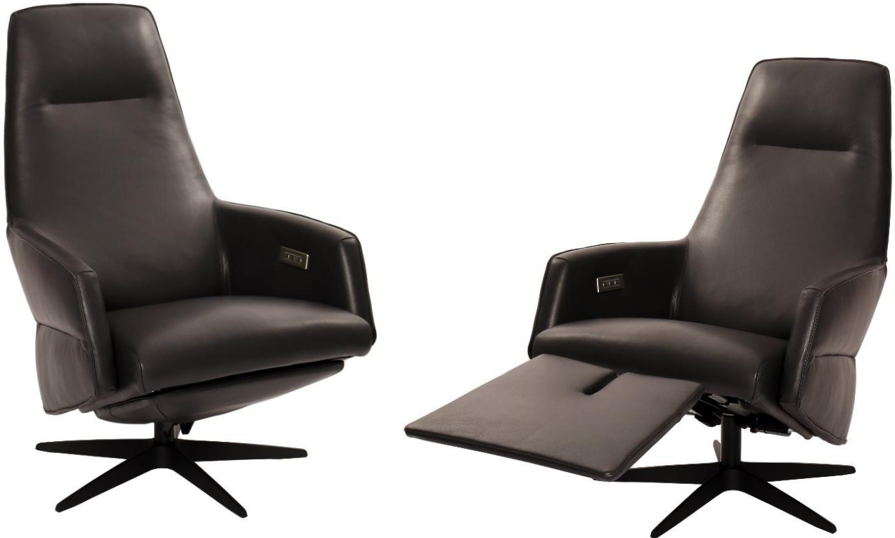
Afgebeeld Model ARC