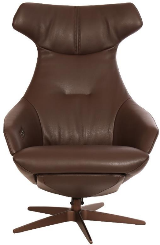
Afgebeeld Model ARC