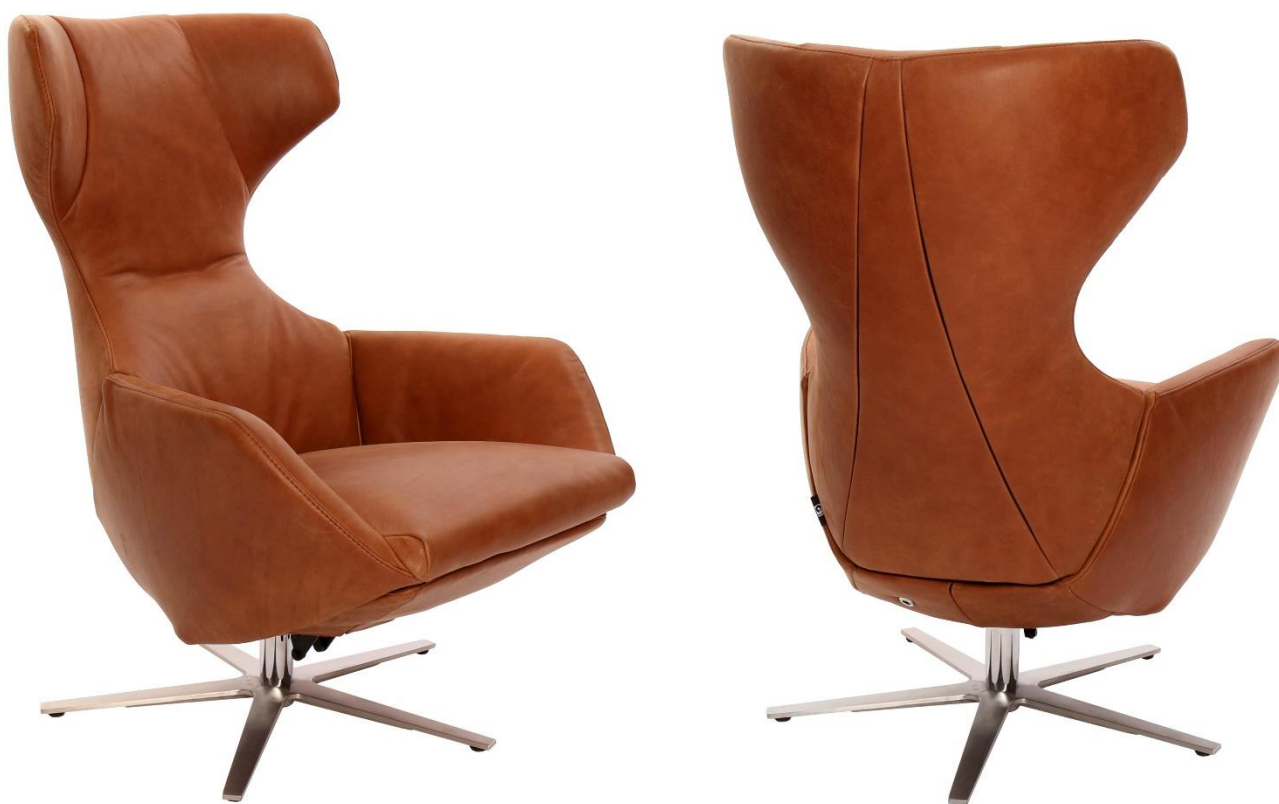
Afgebeeld Model ARC