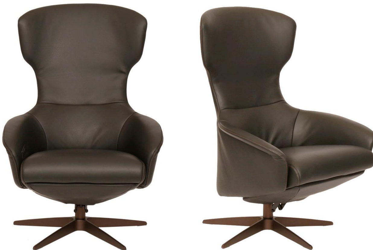
Afgebeeld Model ARC