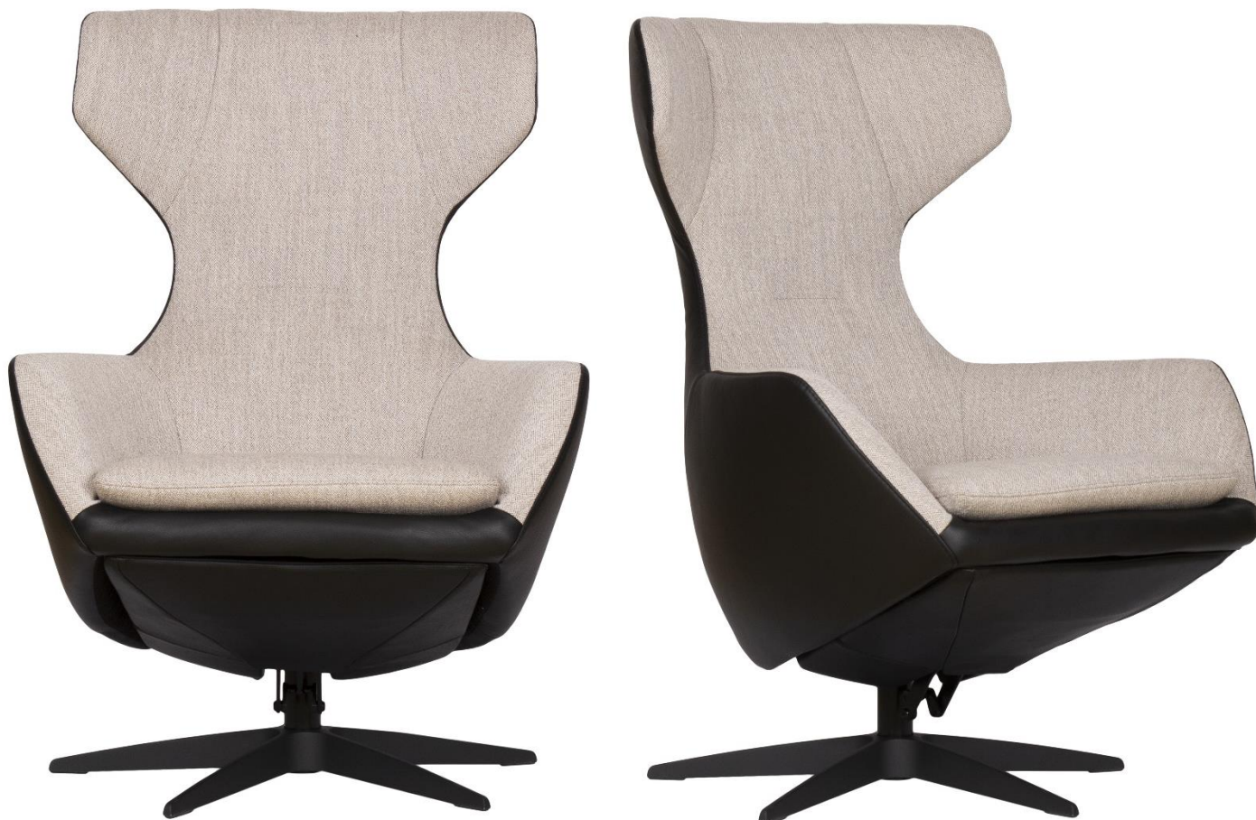
Afgebeeld Model ARC

Basic systeem (zonder voetklep en rug verstelling!)