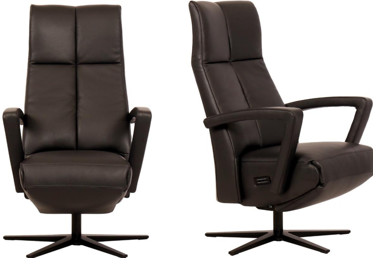
Afgebeeld Model Twinz

Afmetingen (cm): standaard is Medium (M)