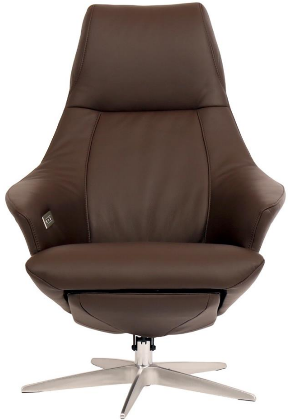
Afgebeeld Model ARC