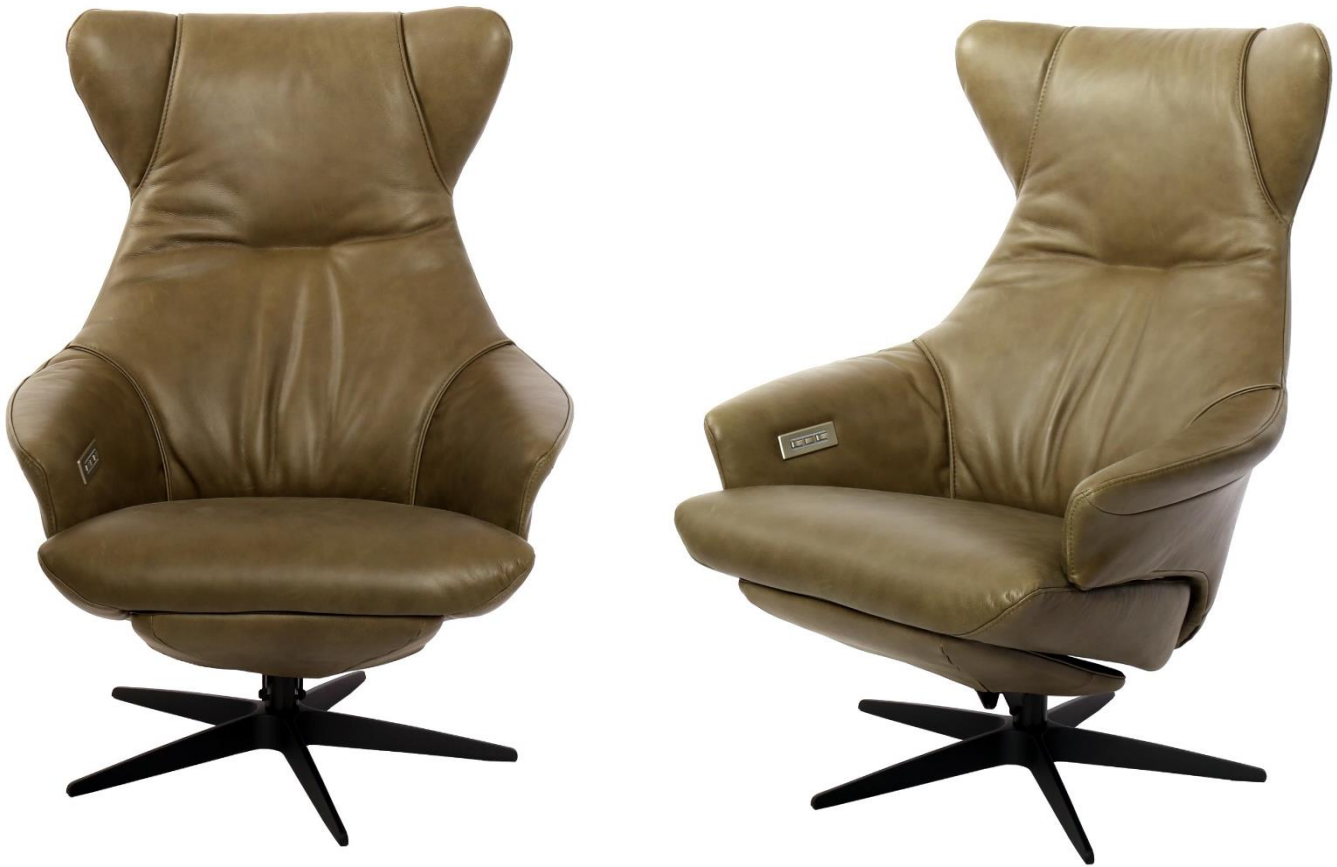
Afgebeeld Model ARC