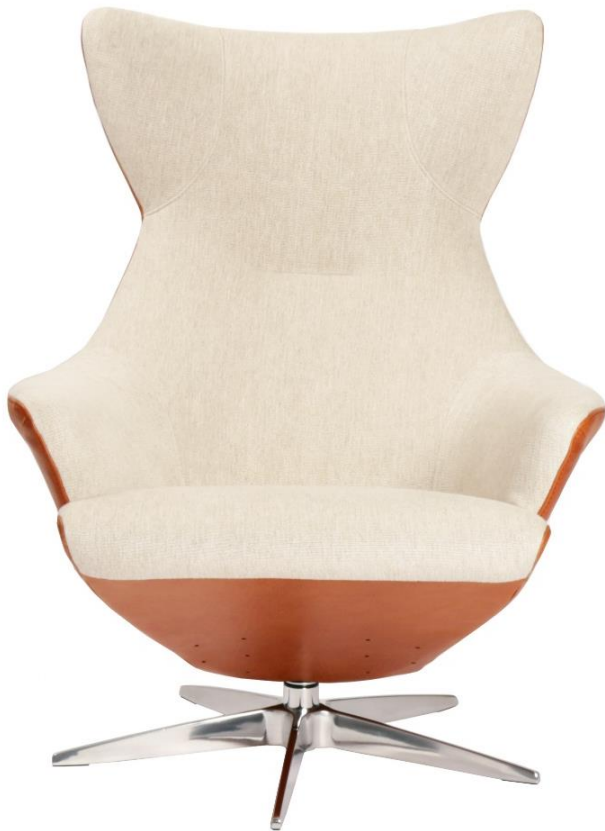
Afgebeeld Model BASIC