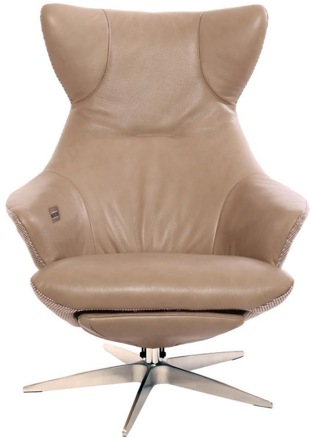
Afgebeeld Model ARC