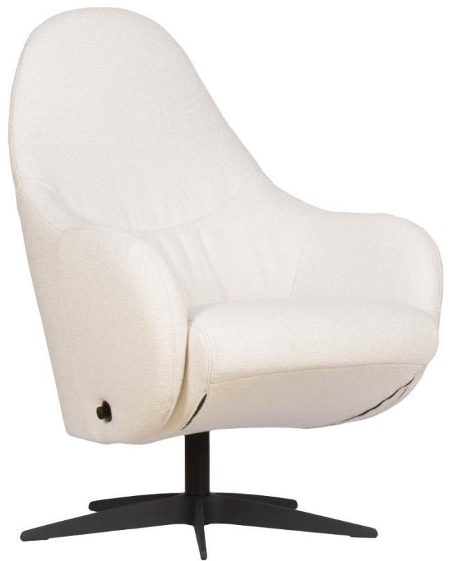
Afgebeeld Model BASIC