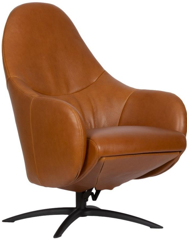
Afgebeeld Model ARC