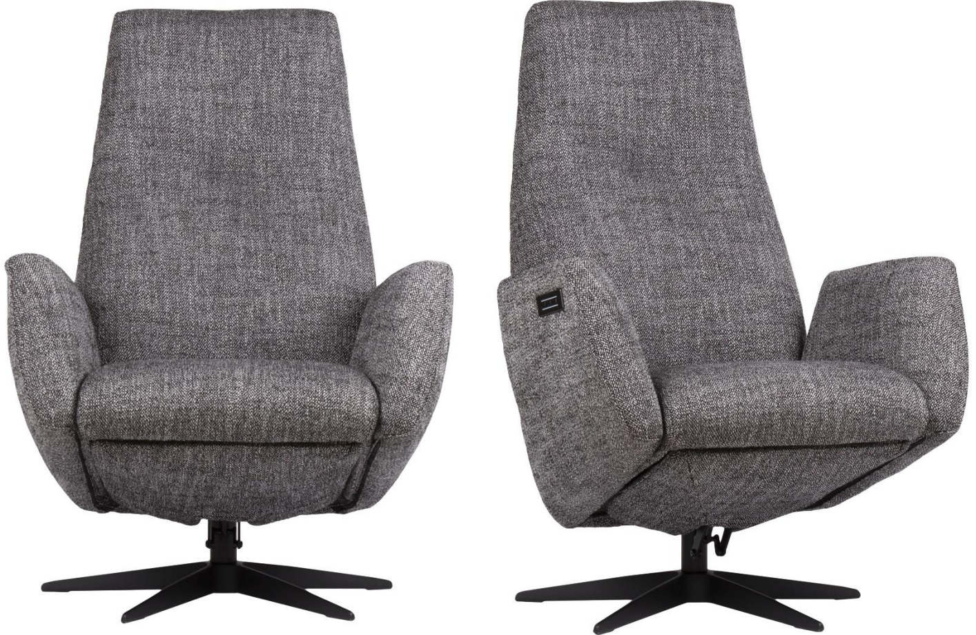
Afgebeeld Model ARC

Basic systeem (zonder voetklep en rug verstelling!)