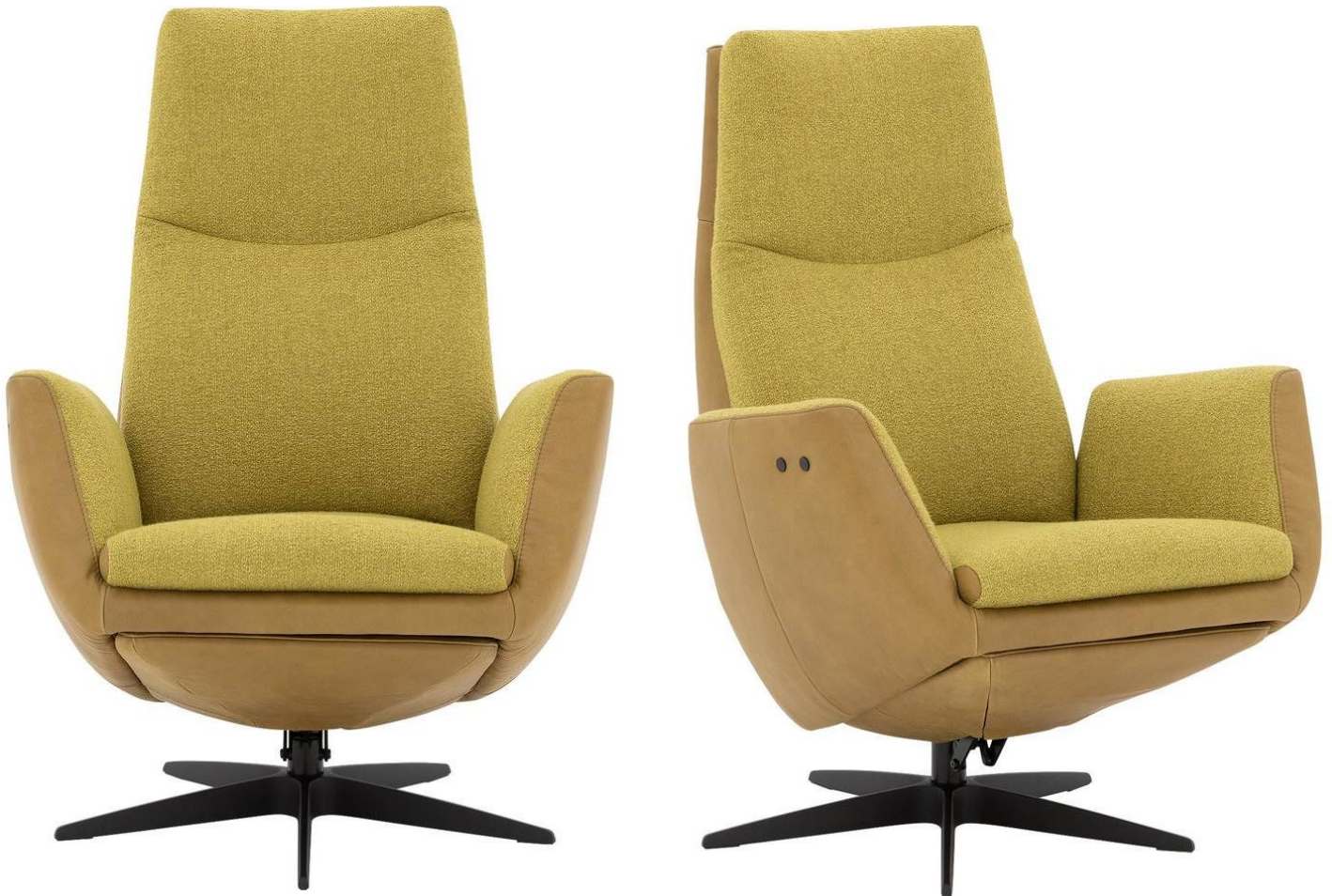
Afgebeeld Model ARC

Basic systeem (zonder voetklep en rug verstelling!)