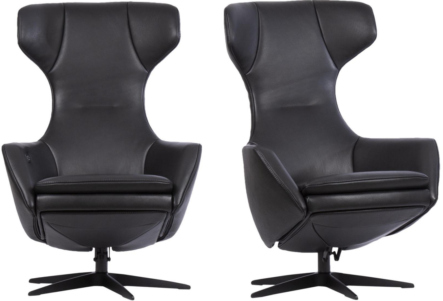
Afgebeeld Model ARC

Basic systeem (zonder voetklep en rug verstelling!)